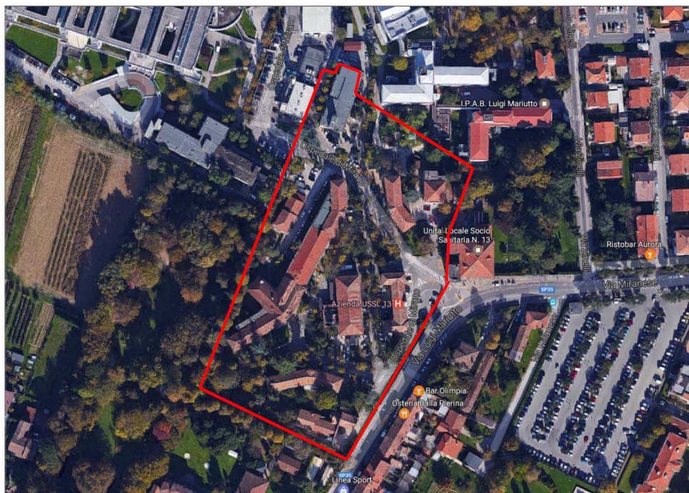
Ospedale civile - Mirano (VE), via L. Mariutto: individuazione su foto aerea (fuori scala - google maps)