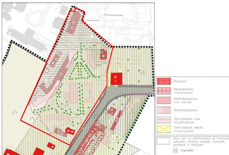
Ospedale civile - Mirano (VE), via L. Mariutto: individuazione su estratto di mappa di PRG (fuori scala)